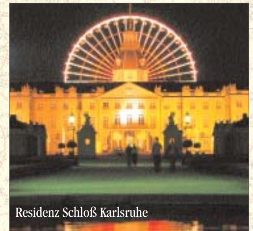
Residenz Schloß Karlsruhe

ab 07:00 Gemütliches Frühstück im Salonspeisewagen/Pullman Ihres „N.I.O.E.“.